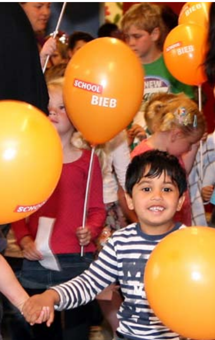
De opening van de eerste schoolbibliotheek in Den Bosch.

“Het gaat erom dat kinderen meer en beter leesmateriaal in handen krijgen: passender, prikkelender en meer aansluitend bij interesses van het kind.”