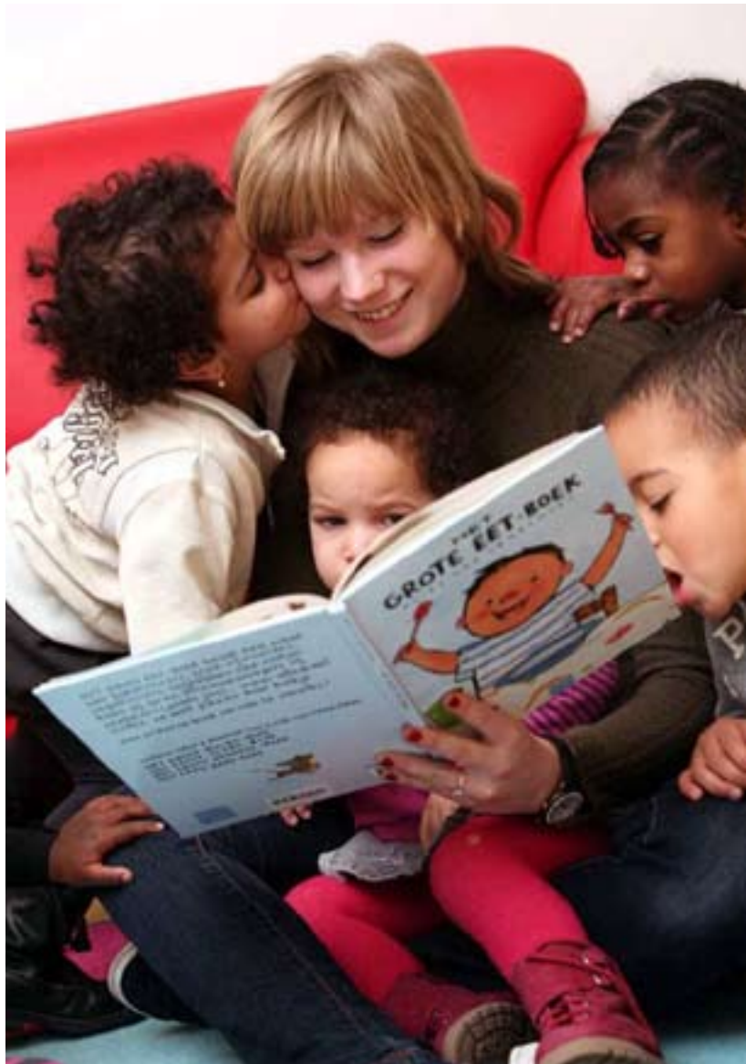
Voorlezen in het kader van BoekStart.

Haring vond de voorleeswedstrijd een heel goed initiatief: