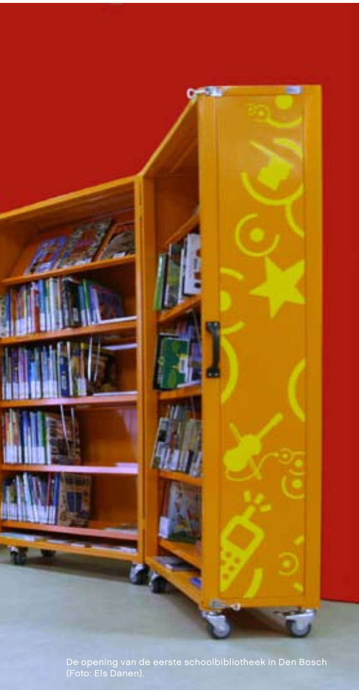
De opening van de eerste schoolbibliotheek in Den Bosch.

Dat je met boeken en leesplezier niet vroeg genoeg kunt beginnen, is de filosofie achter BoekStart . Deze programmalijn is gericht op jonge ouders. Als hun baby drie maanden is, krijgen ze van de gemeente een uitnodiging om bij de bibliotheek het BoekStartkoffertje op te halen: een koffer met een stoffen babyboekje, een cd met kinderliedjes, een boekenlegger en een informatiefolder. De bibliotheekmedewerker leidt de ouders rond